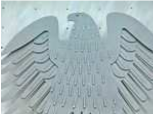
Der Bundesadler

SR, Dienstag, 14. Oktober 2008 im Ersten